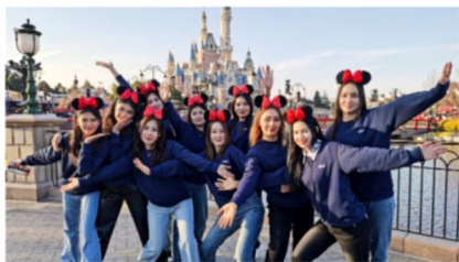
少数民族员工代表游览上海迪士尼