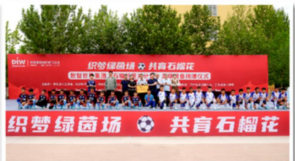
向20所中小学校捐赠2000套足球装备