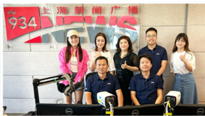
少数民族员工代表录制援疆之声讲述援疆故事